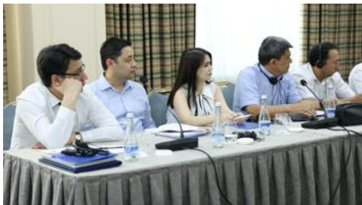
Участники одного из профильных семинаров по СФС, проведенного в Ташкенте в июне 2023 г.

международной практики. В семинарах приняли участие тридцать восемь специалистов из Службы санитарно-эпидемиологического благополучия и общественного здоровья, Государственного комитета по ветеринарии и развитию животноводства и Агентства по карантину и защите растений. Более подробная информация о семинарах доступна в этой веб-истории .